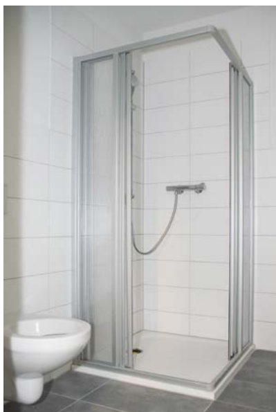
Manche der neuen Bäder sind mit neuen Duschkabinen und andere mit neuen Badewannen ausgestattet. Die Wände sind mit großformatigen, hellen Fliesen gestaltet.