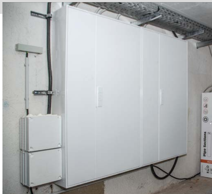
Neue Elektroverteilungen wurden im Keller der Hauseingänge installiert (Bild oben).

Nachdem die Strangsanierung in den beiden Hauseingängen Triniusstraße 28 und 28a Ende Juni wie geplant fertiggestellt werden konnte, hat sich die Strangsanierung in den beiden Nachbarhäusern mit wiederum 16 Wohnungen ab Anfang August angeschlossen. Auch hier wurden die alten Leitungen für Warm- und Kaltwasser sowie Abwasser erneuert. Die alten Elektroverteilungen im Hausflur wurden zurückgebaut und im Keller neue installiert. Im Haus Triniusstraße 28b waren diese Elektroarbeiten bereits vor einigen Jahren ausgeführt worden. In allen 16 Wohnungen wurden die Bäder komplett erneuert. Es wurden neue Badewannen, neue Sanitärkeramik installiert und moderne Fliesen verlegt. Auch in den Küchen wurde ein neuer Fliesenspiegel angebracht. Weiterhin erhielten die Wohnungen in Küche und Flur neue Bodenbeläge mit moderner Holzoptik. Die Arbeiten in einer Wohnung nahmen in der Regel ca. zwei Wochen in Anspruch. Inzwischen sind in den beiden Häusern die Arbeiten abgeschlossen. Herzlich bedanken möchten wir uns bei den betroffenen Mietern für ihr Verständnis und die gute Zusammenarbeit mit unserem Baukoordinator und den ausführenden Handwerkern. In den warmen Monaten des kommenden Jahres soll die Strangsanierung in den beiden Hauseingängen 28d und 28e fortgesetzt und abgeschlossen werden.